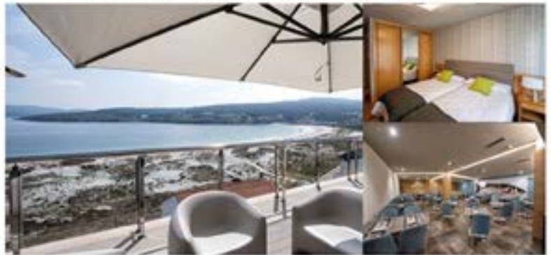
Hotel VIDA Finisterre Centro **